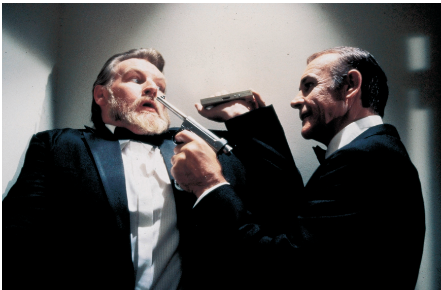
Nigdy nie mów nigdy, reżyseria Irvin Kershner