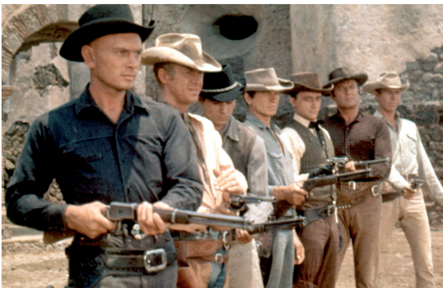
Siedmiu wspaniałych, reżyseria John Sturges