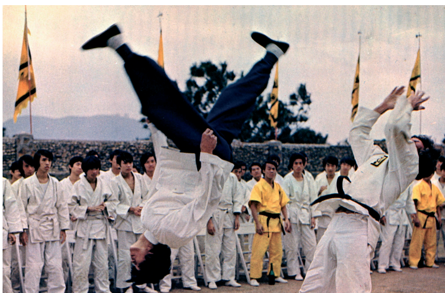
Wejście smoka, reżyseria Robert Clouse