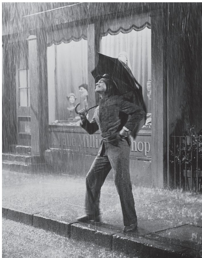
Deszczowa piosenka, reżyseria Stanley Donen, Gene Kelly