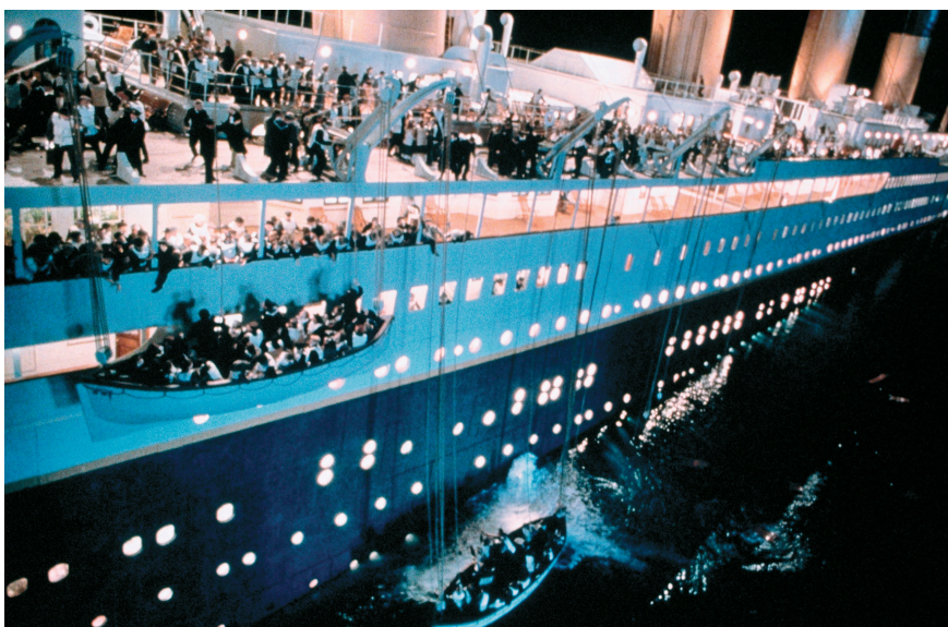
Titanic, reżyseria James Cameron