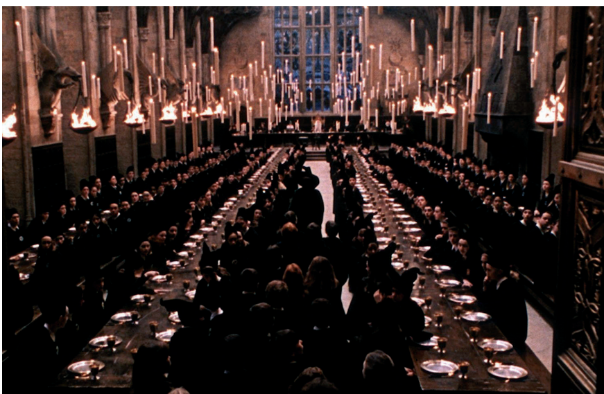
Harry Potter i kamień filozoficzny, reżyseria Chris Columbus