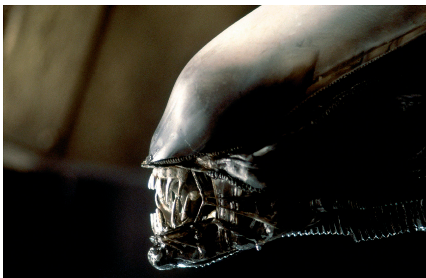
Obcy – ósmy pasażer Nostromo, reżyseria Ridley Scott