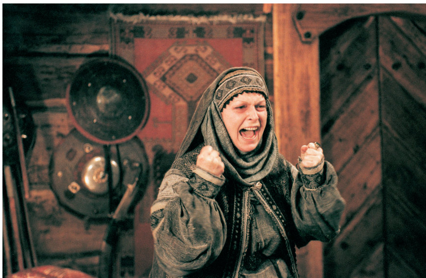
Ogniem i mieczem, reżyseria Jerzy Hoffman